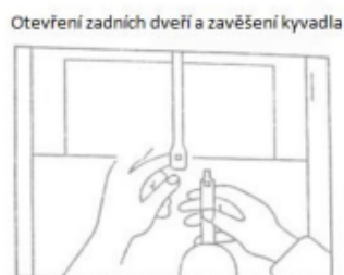
Obrázek č. 3

Внимателно отстранете гумените ленти от пантите на махалото на часовника. Дръжте окачването на махалото отгоре в едната си ръка и махалото в другата си ръка. След това съединете двете части заедно, като поставите махалото в частите за окачване на махало (виж фигура 3). Светлата страна на махалото трябва да сочи напред.